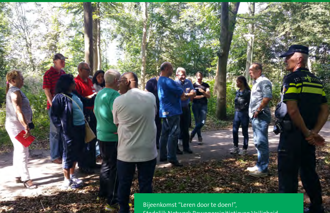
Bijeenkomst "Leren door te doen!", Stedelijk Netwerk Bewonersinitiatieven Veiligheid (29 augustus 2015).